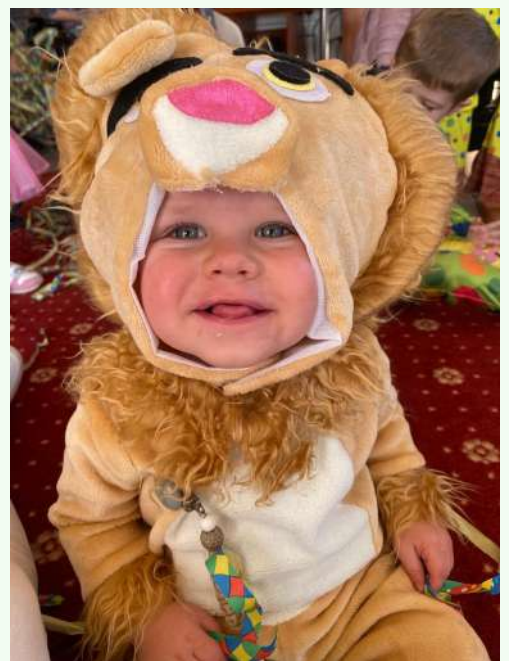
Lions, Mini et Dinosaures sont venus faire la fête.